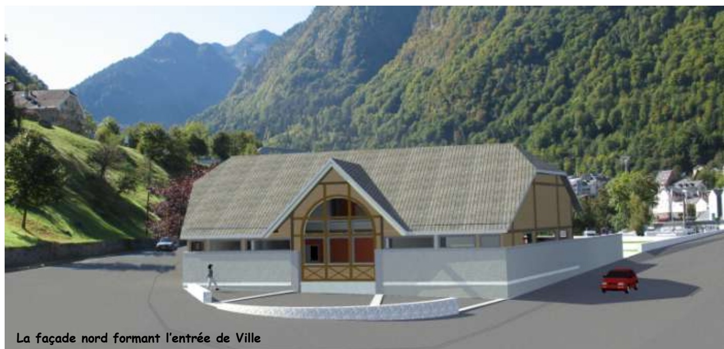
La façade nord formant l'entrée de Ville