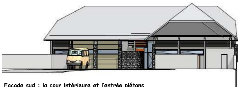
Façade sud : la cour intérieure et l'entrée piétons

Les exigences fonctionnelles nécessitent l'optimisation des circulations piétonnes ainsi que celles des véhicules de secours par une disposition appropriée des locaux opérationnels. Cet objectif a été atteint par la